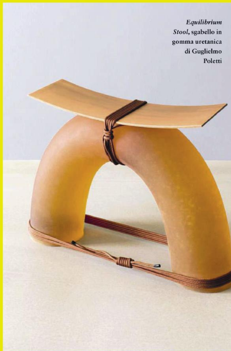
Equilibrium Stool, sgabello in gomma uretanica di Guglielmo Poletti