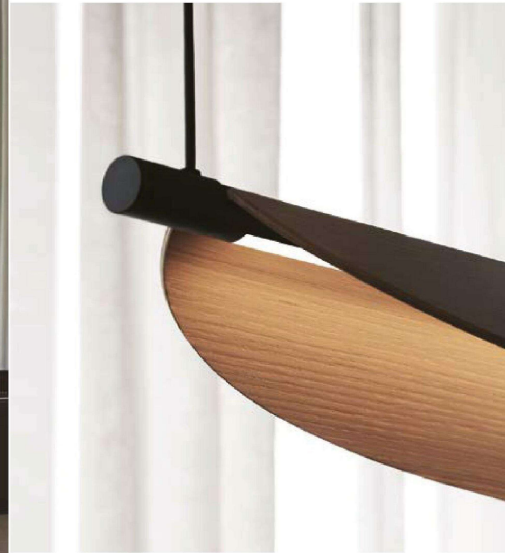
Lampada Thula disegnata per il marchio Tooy e contenitori per Rabitti. Pagina accanto, dall'alto: Uma per Lema, Livrette per Gallotti&Radice, Huli per Frigerio e Kokoro per Manerba.