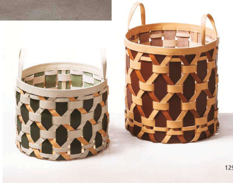
Thula lamp designed for the Tooy brand and containers for Rabitti. Opposite page, from top: Uma for Lema, Livrette for Gallotti & Radice, Huli for Frigerio and Kokoro for Manerba.